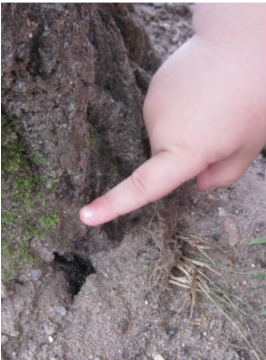
Наблюдение за муравьями