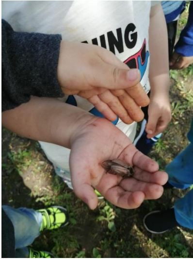
Наблюдение за майским жуком